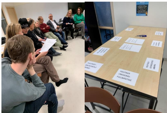
Dialog unga och vuxna politiker

Många av frågorna som vi i ungdomsfullmäktige driver handlar om skolan på olika sätt. Därför är vår dialog med grundskolenämnden viktig. Vi hade en dialog med nämnden i höstas som handlade om elevers delaktighet och inflytande i skolan hur kan vi arbeta mot kränkningar och trakasserier i skolan.