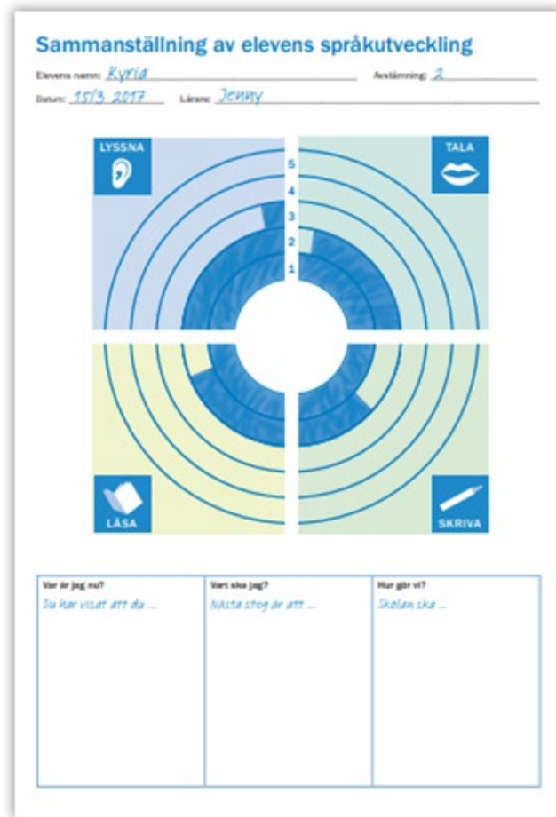
Figur C. Exempel på ett flytt underlag för återkoppling