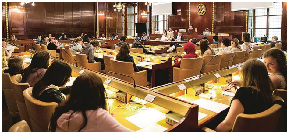
Bilden föreställer ett möte i Ungdomsfullmäktige som hålls inne i Börshuset i Brunnsparcken. Det hålls fem möten per år.

De 101 ledamöterna i ungdomsfullmäktige är förtroendevalda. Det innebär att andra unga har röstat fram dem i valet till ungdomsfullmäktige. Alla barn och unga som bor i Göteborg och har börjat femte klass men inte fyllt 18 år får rösta.