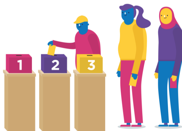
Bilden föreställer tre unga som står i kö för att rösta.