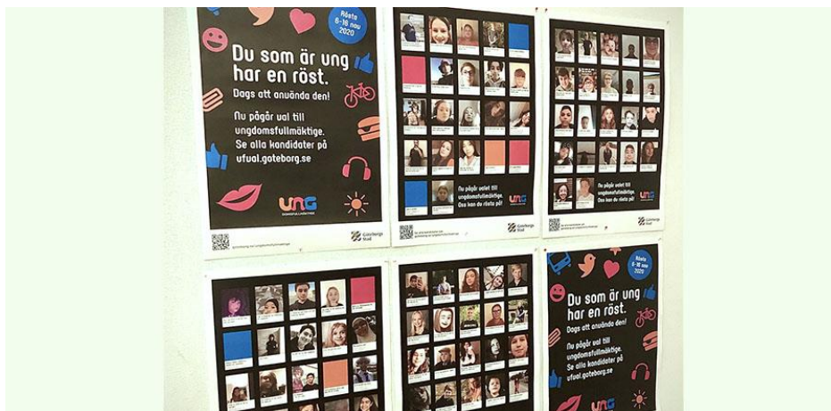
Bilden föreställer valaffischer på kandidater i valet till ungdomsfullmäktige.

Vi på grundskoleförvaltningen har tillsammans med stadsledningskontoret lett en samverkansgrupp med deltagare från några av stadens förvaltningar. I gruppen ingick stadens fyra socialförvaltningar, idrotts- och föreningsförvaltningen, utbildningsförvaltningen, konsument- och medborgarservice, och kulturförvaltningen. Tillsammans har vi bland annat affischerat på medborgarkontor och andra mötesplatser. Våra invånarguider har informerat om valet lokalt i staden. Utbildningsförvaltningen har också tydligt kommunicerat till de kommunala gymnasieskolorna att eleverna ska få rösta under skoltid.