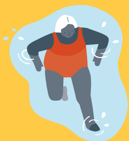
Från utställningen Världens spel.

Du hittar alla simhallar på: goteborg.se/simhallar