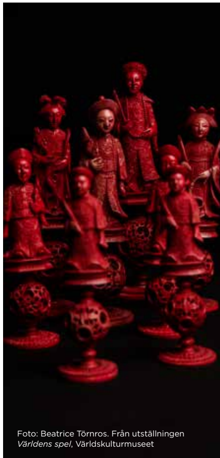
Från utställningen Världens spel , Världskulturmuseet