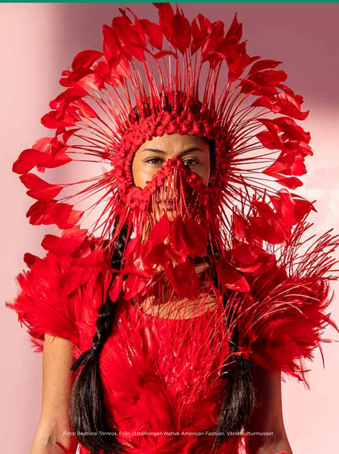
Från utställningen Native American Fashion , Världskulturmuseet