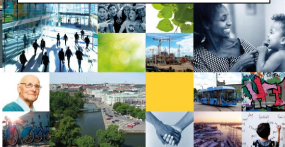
Göteborg – en hållbar stad

Dialog med barnslivet för ett socialt hållbart Malmö Malmö stad bildar ett forum för social