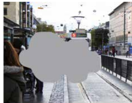
Åldersförändringar i gula fläcken