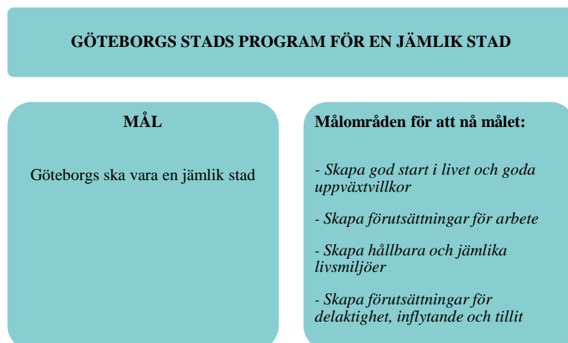
Figur 2 Programmets övergripande struktur

Detta program inleds med en beskrivning av målet med Göteborgs Stads jämlikhetsarbete. Därefter beskrivs var och ett av de fyra målområdena som stadens jämlikhetsarbete kommer fokusera på för att uppnå målet. Efter beskrivningen av varje målområde följer strategier som är av betydelse för arbetet. Varje målområde har mellan fem och sju strategier som anger fokus för arbetet.